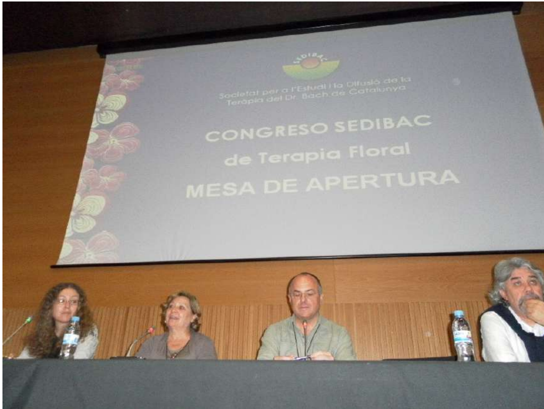
Mesa de apertura. Presidentes de las Asociaciones españolas de Terapia Floral.

Estuvimos allí, en esta nueva edición del Congreso de Terapia Floral organizado por Sedibac con la colaboración de las asociaciones de Terapia Floral en España: Seflor , Flobana y Galibach .