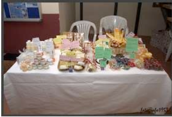
Artículos de regalo todos artesanales, hechos por los socios y voluntarios de Adea