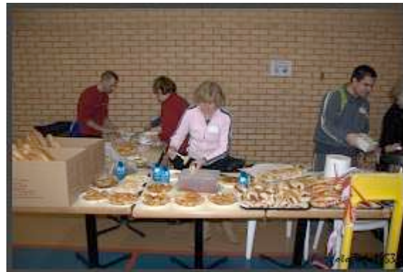
La intendencia, muy importante para reponer fuerzas, además de poder disfrutar de ricas viandas preparadas con amor

Nuestro espacio terapéutico en nombre de SEFLOR. Hacemos algunas sesiones de terapia, provechosas tanto para clientes como para terapeutas. Nos vamos combinando entre las tres que estamos allí.